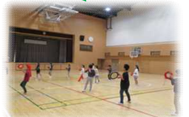
子ども教室ソフトバレーボール