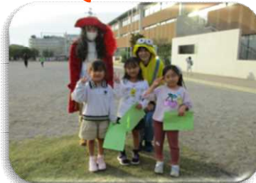
子ども教室ドッジボール