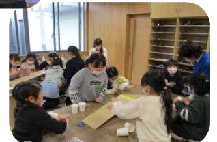
【昨年度の子ども教室の様子】

*記録用の写真をHPやおたより等に掲載することがあります。掲載を同意されない方は事前にご連絡ください。