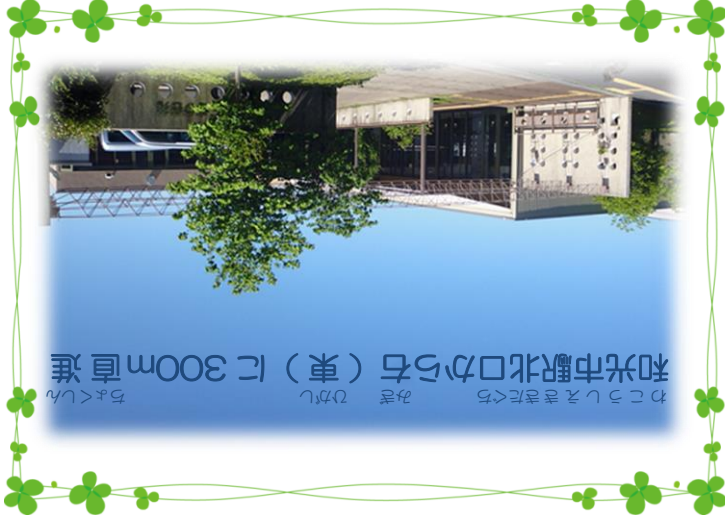
わこうしえききたから右(東)に300m直進 和光市駅北口から右(東)に300m直進

わこうしやかいふくしきよきょうかい 和光市社会福祉協議会「わしやもん」 自分の目標にあってるか、 したいとができるか、 内容をよく見てね！