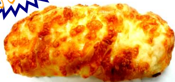
ベーマヨオニオン ¥170