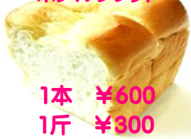
1本 ¥600 1斤 ¥300