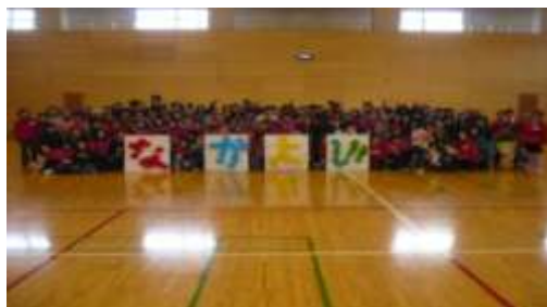
昨年の集合写真です。